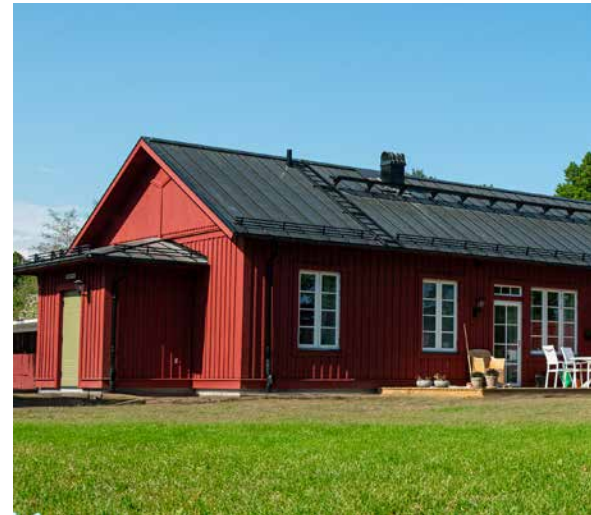
Då det tyvärr ännu inte finns gräs på Höckensvägen lät vi AI