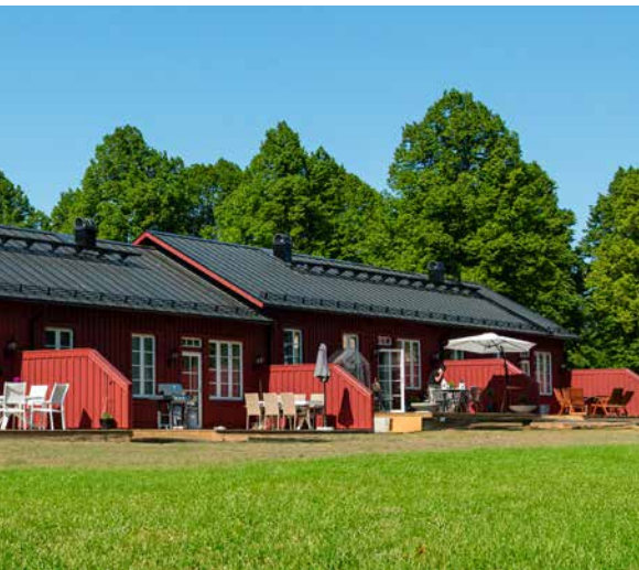
lägga gräsmattan.