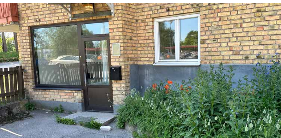
Bakom denna port på Vallvägen 14 finns potential för dig som vill hyra en lokal för din verksamhet

kvadratmeter ledig. Med fem rum, bra förrådsytor, tvätt- och torkutrymme, kök samt flera toaletter ges många möjligheter. Addera till en mindre uteplats i söderläge, carport med elladdningsmöjligheter, samt en stor parkliknande innegård, som bjuder in till personalaktiviteter och trivsel, så är du hemma.