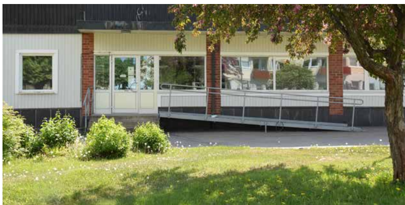
Denna tillgänglighetsanpassade lokal på Smedvägen i Iggesund har hela 177 kvadratmeter nyrenoverad yta

I mångkulturella Iggesund finns stora möjligheter att skapa något unikt och efterlängtat. Är du redan etablerad och funderar på att expandera till Hälsingland, så är Glada Hudikhems tillgänglighetsanpassade lokal på 177 kvadratmeter i Iggesund, en riktig pärla.