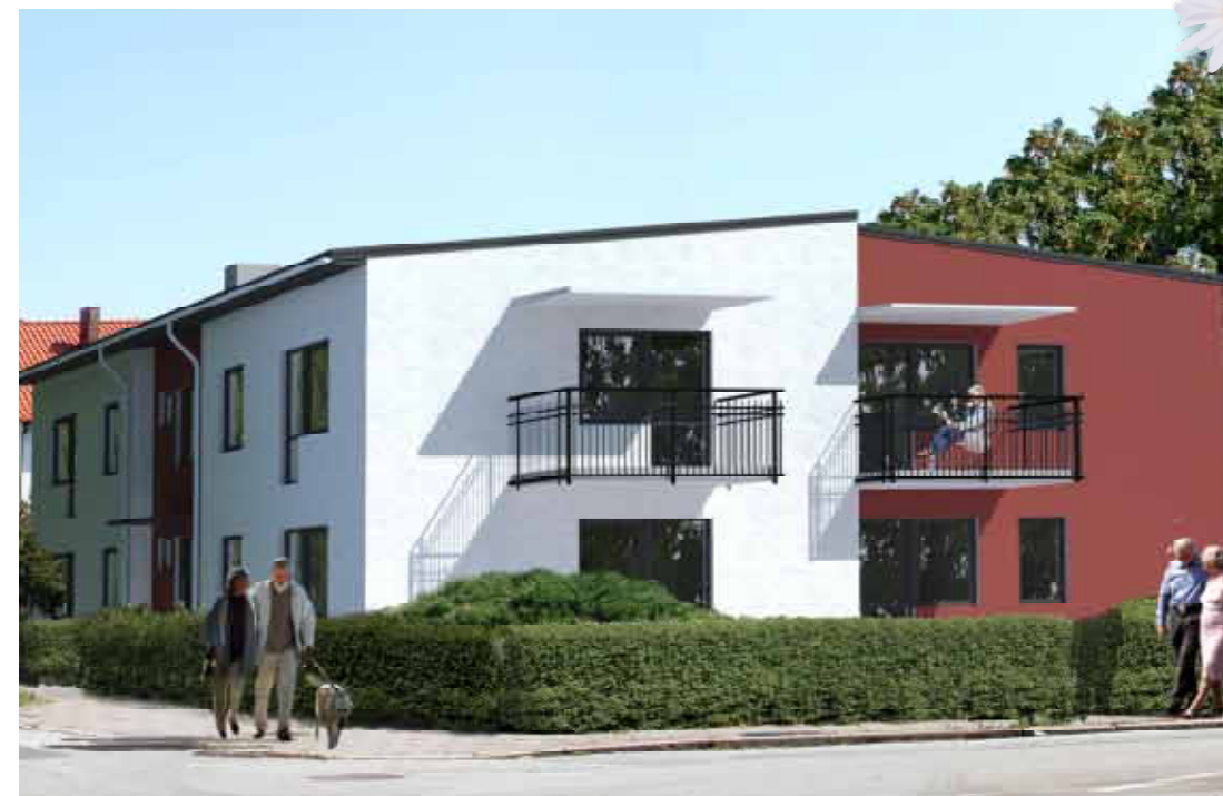
Så här fint kommer det nya trygghetsboendet bakom Tryggebo att se ut när det står klart. Varje lägenhet har sin egen uteplats eller balkong och huset har hiss.

De nya lägenheterna kan bokas redan idag av alla som är 70+. Den som söker lägenhet centralt i Iggesund kan tillgodoräkna sig den kötid man har idag. Lägenheterna kommer att saluföras efter sommaren.