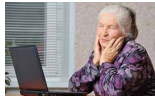
Du kan anmäla dig redan nu om du är intresserad av att bo i det nya trygghetsboendet.

De nya lägenheterna kan bokas redan idag av alla som är 70+. Den som söker lägenhet centralt i Iggesund kan tillgodoräkna sig den kötid man har idag. Lägenheterna kommer att saluföras efter sommaren.