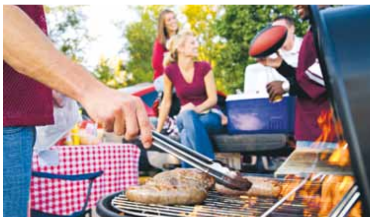
Grilla, träffas och njut av den svenska sommaren - tänk på att umgås så att dina grannar inte blir störda.

Nu börjar grillsäsongen. Men innan du tar med dig majskolven eller köttbiten ut i det gröna vill vi påminna dig om några saker;