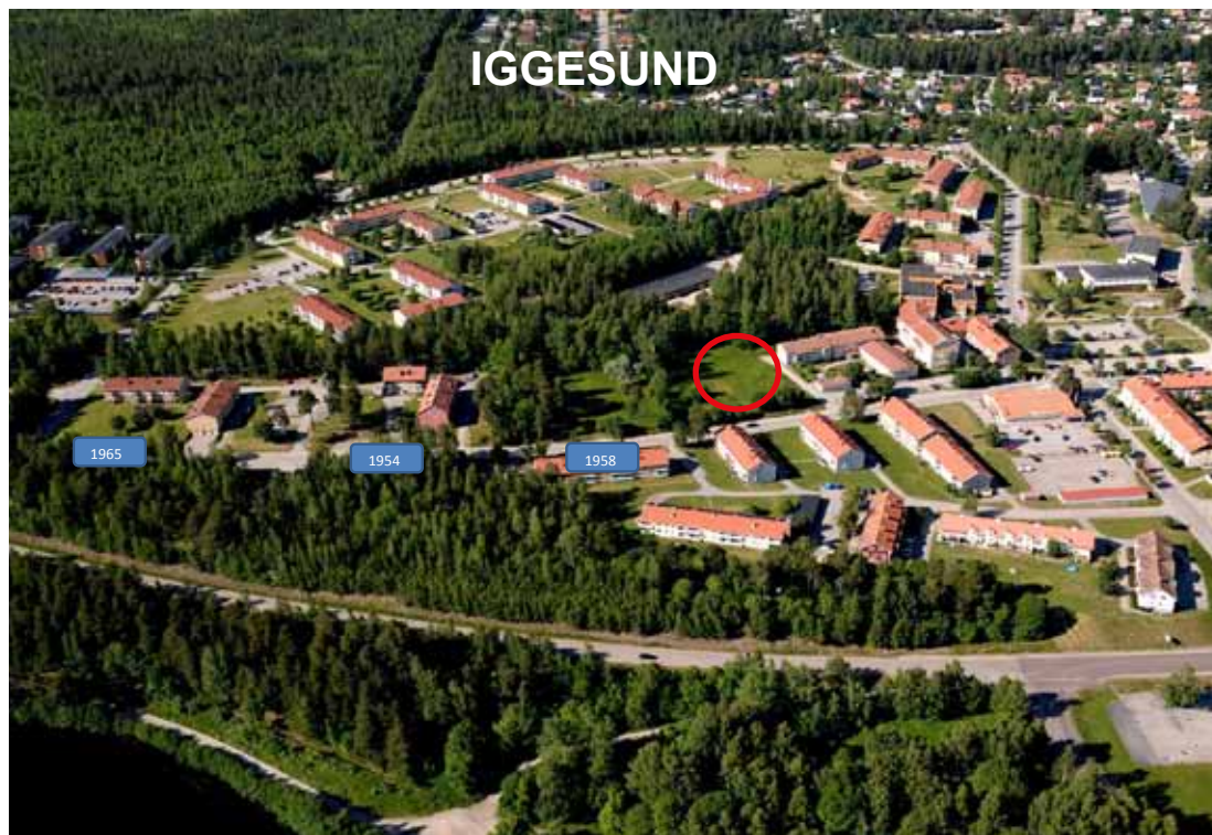
Här, i centrala Iggesund, på tomten bakom Tryggebo, vid den röda markeringen kommer det nya huset att byggas.

Lägenhetsytorna blir 61 m 2 i tvåorna och 72 m 2 i treorna och båda har extra rymliga badrum. Hyrorna kommer att ligga på 7.500 kr/mån för treorna och 6.400 kr/mån för tvåorna. Alla lägenheter har antingen balkong eller egen uteplats.