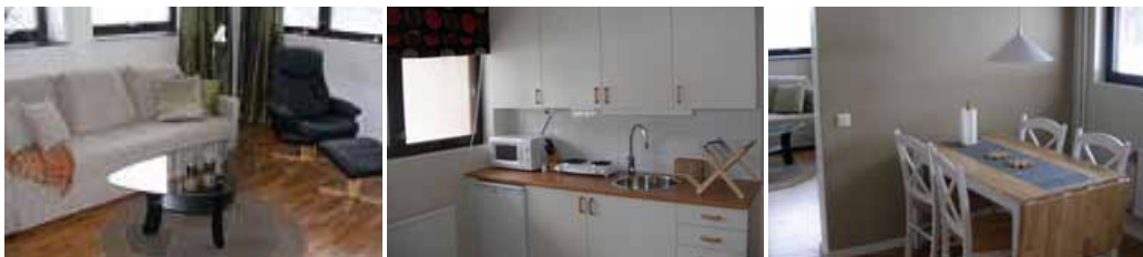
Översta bilden är från gästlägenheten i Delsbo. De tre nedersta bilderna visar gästlägenheten på Håsta.

Vi är stolta över att kunna erbjuda våra hyresgäster möjlighet att hyra en gästlägenhet för släkt och vänner på besök.