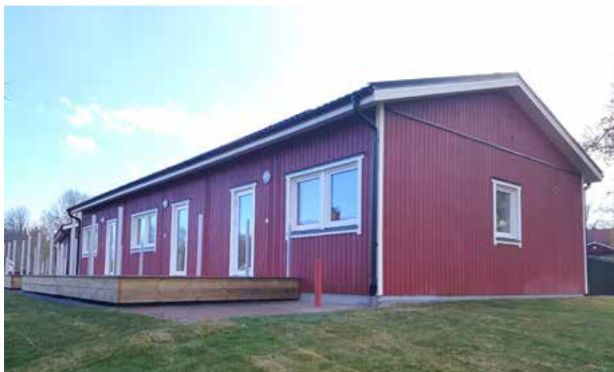
Överst de nybyggda husen. nedan den gamla samt planritning av de nya lägenheterna.