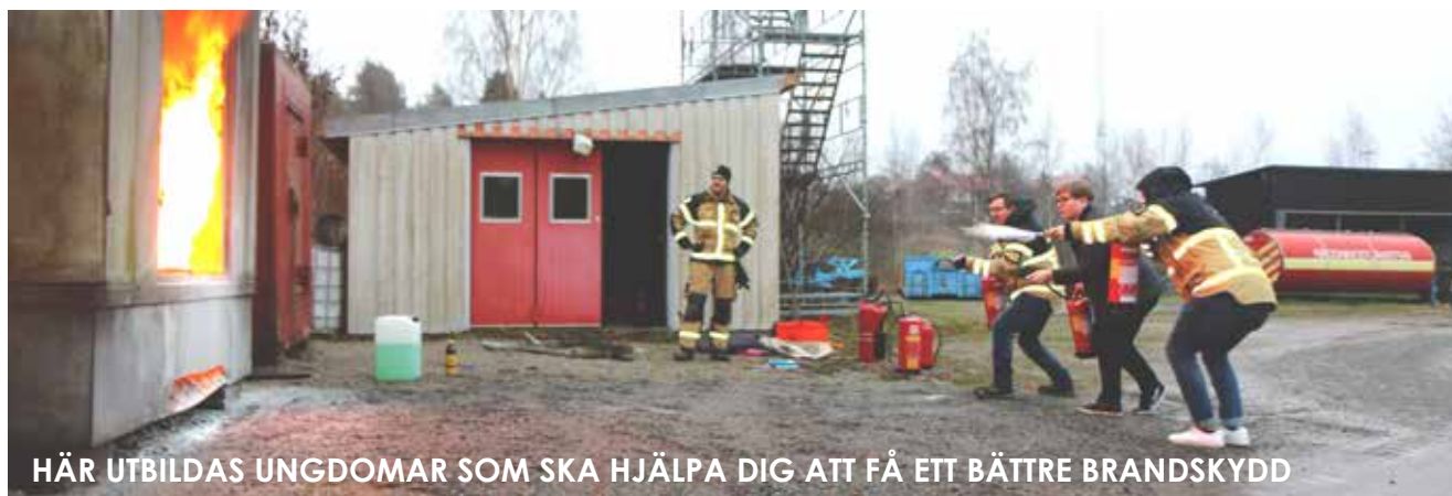
HÄR UTBILDAS UNGDOMAR SOM SKA HJÄLPA DIG ATT FÅ ETT BÄTTRE BRANDSKYDD

HEMBESÖKET ÄR FRIVILLIGT OCH KOSTAR INGENTING!