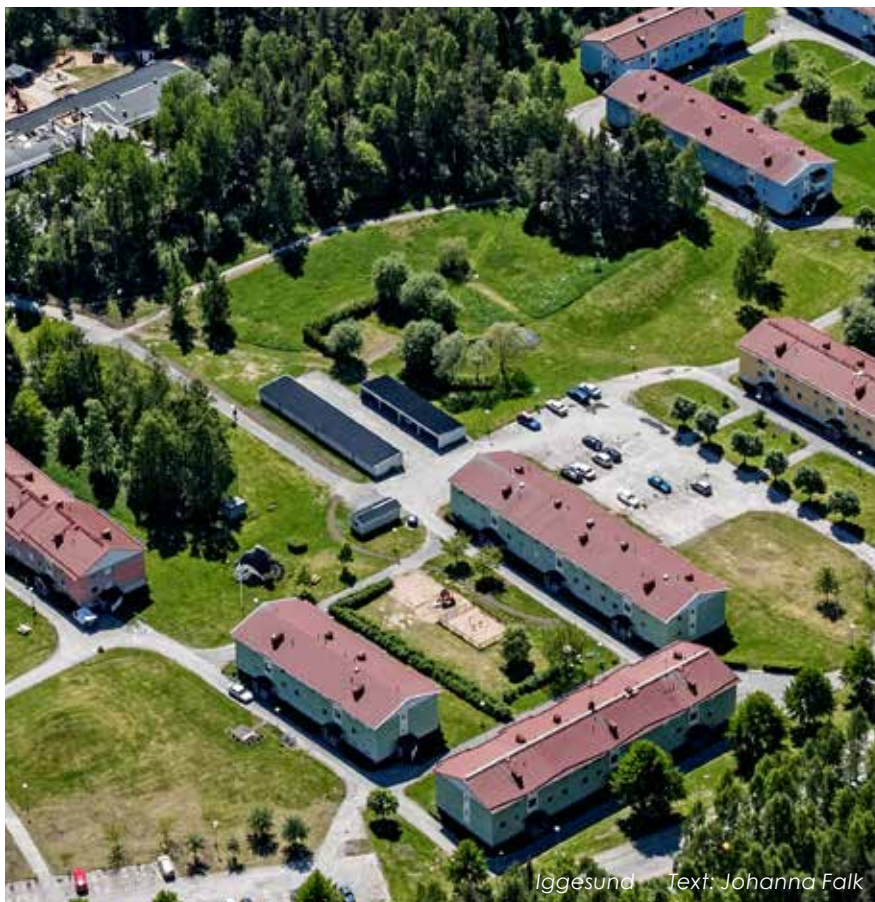
Iggesund