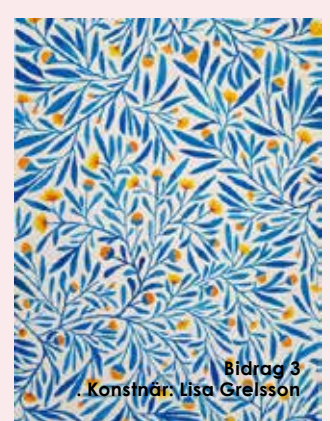
Bidrag 3 Konstnär: Lisa Greisson