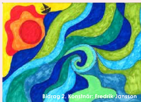
Bidrag 2. Konstnär: Fredrik Jansson