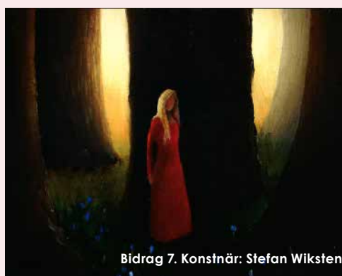
Bidrag 7. Konstnär: Stefan Wiksten