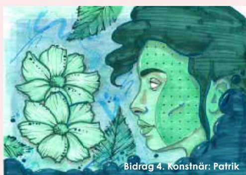
Bidrag 4. Konstnär: Patrik