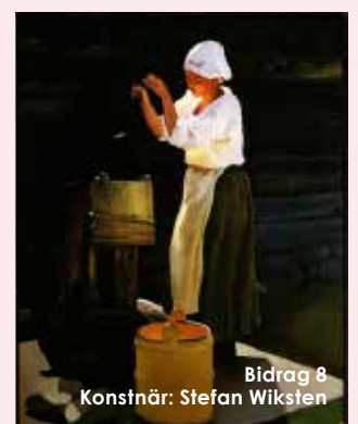
Bidrag 8 Konstnär: Stefan Wiksten