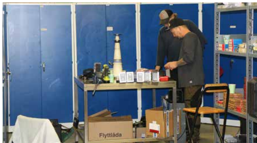
Motorgrillspetten har blivit en riktig succé över hela landet

är i behov av delar till sina maskiner. Toomas påpekar att han inte konkurrerar med Delsbos andra järnhandel utan att de kompletterar varandra på ett bra sätt.