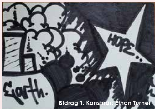
Bidrag 1. Konstnär: Ethan Turner