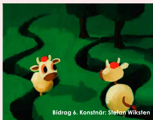
Bidrag 6. Konstnär: Stefan Wiksten