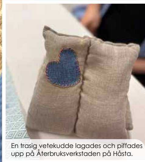
En trasig vetekudde lagades och piffades upp på Återbruksverkstaden på Håsta.

Thea Thanprasit tänker hållbart även privat såväl när det kommer till mat som lagning av trasiga kläder.