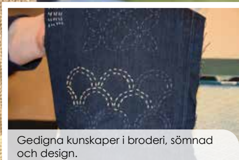
Gedigna kunskaper i broderi, sömnad och design.