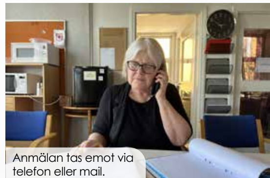
Anmälan tas emot via telefon eller mail.