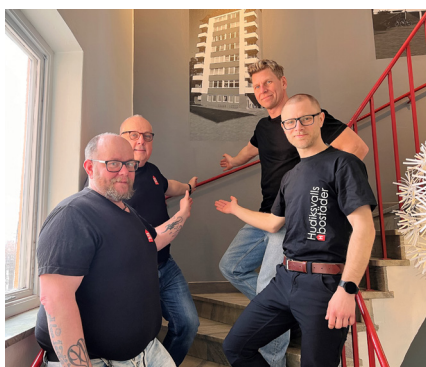
Områdesförvaltarna visar vägen in till vår centrala felanmälan på huvudkontoret.

- Arbetet har fått ta den tid som behövs. Det är en stor verksamhet med många avdelningar och anställda.