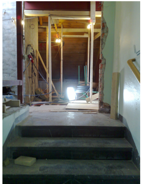
Den blivande entréhallen