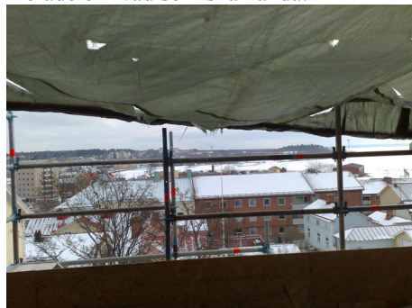
En del av den framtida utsikten