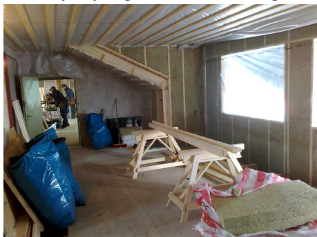
Ett annat blivande kök och vardagsrum

Entreprenören som har generalentreprenaden för bygget är Hälsingebygg. Bygget är planerat att pågå fram till sommaren och preliminärt inflyttningsdatum för de nya hyresgästerna är den 1 augusti.