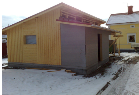
Här kommer det nya soprummet och cykelrummet att inrymmas

Många som har pratat med mig tycker att utsikten blir fantastisk från de nya lägenheterna och det kan jag förstås hålla med om. Dessutom har många sagt att de nya förråden i källarplanet blev väldigt bra. Personligen tycker jag att det är bättre med helt täckta väggar och dörrar till förråden och det verkar även hyresgästerna tycka.