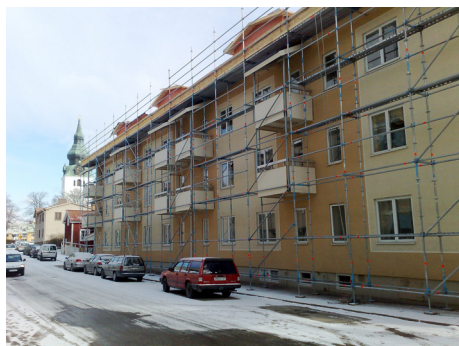
Fastigheten Tutaren 1, S. Kyrkogatan 6 i Hudiksvall