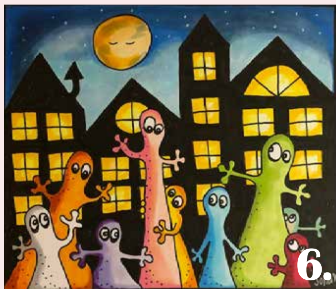
Bidrag 6. Konstnär: Sofia Klingefors