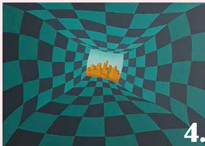
Bidrag 4. Konstnär: Lars Eriksson