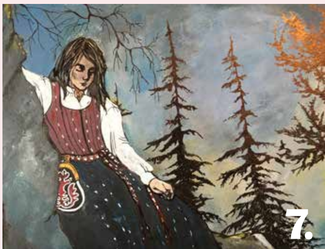
Bidrag 7. Konstnär: Pernilla Andersson