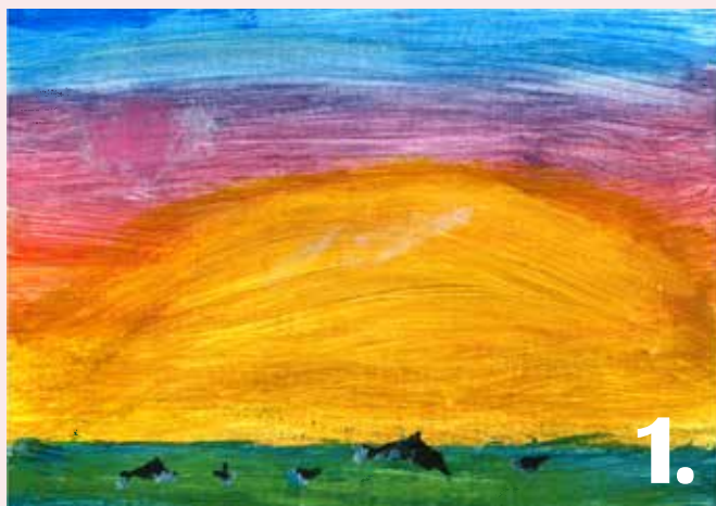
Bidrag 1. Konstnär: Erlis Sixtensson