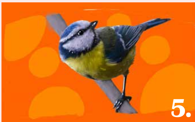
Bidrag 5. Konstnär: Patrik Larsson