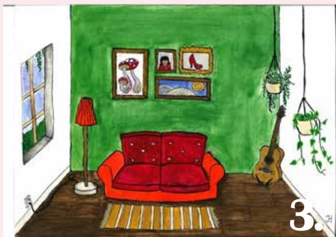
Bidrag 3. Konstnär: Josefin Holm