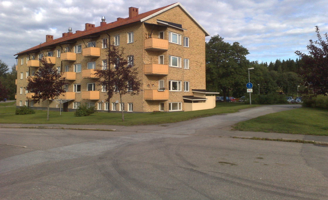
Ett av husen på Vallvägen