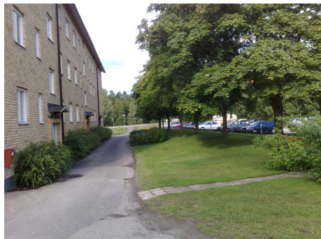
Gångväg till ett av husen