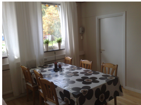
Vy över lunchrummet

Lunchrummet är stort och luftigt och här finns ett litet kök och bra möjligheter att värma mat och äta. Om vi fick önska någonting skulle det i så fall vara en uteplats i direkt anslutning till lokalerna, säger Elisabeth.