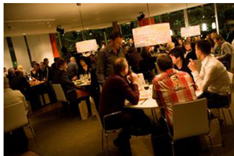
Del av Radjos