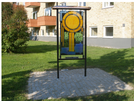
Konstverket på innergården

På området finns även konstnärlig utsmyckning som t ex konstverket på bilden nedan. Detta verk invigdes under 2007.