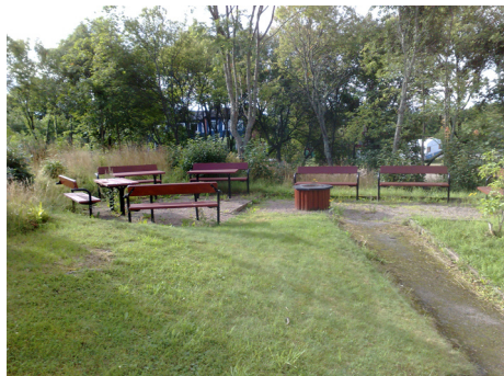
En av de två grillplatserna