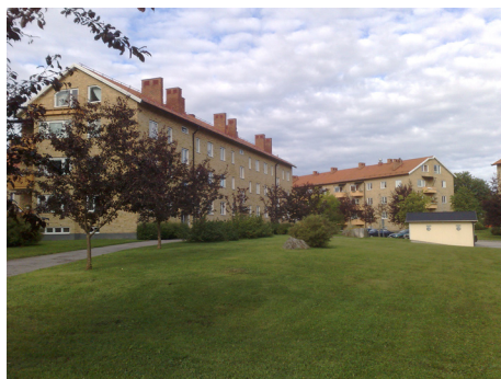
Två av husen på Vallvägen