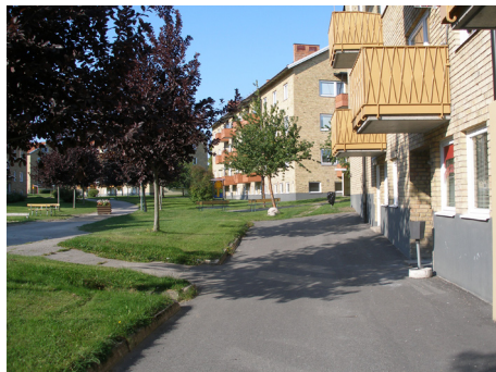
Vy över innergården på Vallvägen

Några av de företag som för närvarande är kunder hos Mittstäd är ICA Maxi och Trima. Kunderna och omsättningen har stadigt ökat från starten och verksamheten har inte påverkats av lågkonjunkturen.