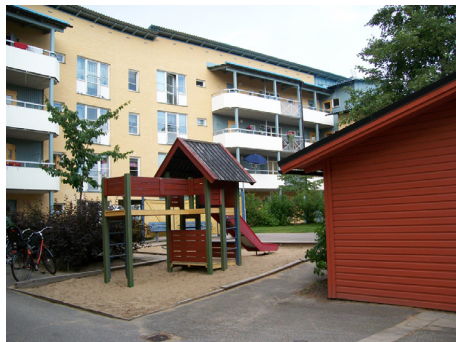
Här leker barnen på Solbågen