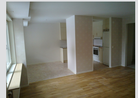
Köket i den ena lägenheten

From den 1 maj finns två nya lägenheter på Solbågen i Hudiksvall. Det är två stycken tvåor på 53 respektive 63 kvm som ligger i bottenplan. Lägenheterna var tidigare en kvarterslokal som disponerades av Hyresgästföreningen.