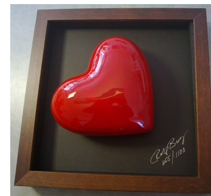
Konstverket av Rolf Berg

För att vara med om utlottningen av konstverket måste du senast den 30 juli skicka ett brev till: Hudiksvallsbostäder, Leif Härdner, Box 1123, 824 13 Hudiksvall eller ett mejl till: leif.hardner@hudiksvallsbostader.se . Ange att du vill vara med på utlottningen.