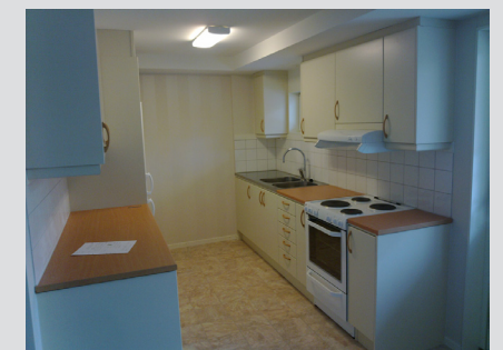
Köket i den andra lägenheten