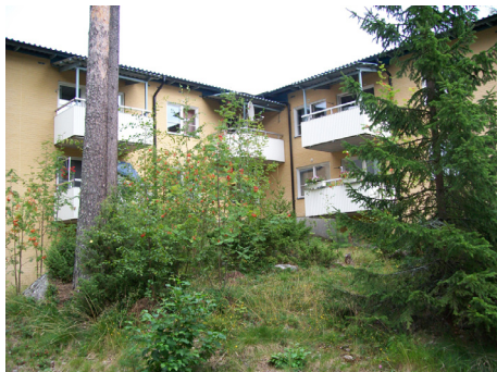
En grön fläck på kartan?

Avståndet till Hudiksvalls centrum är ca 3 kilometer. Dit kan man med fördel ta sig via buss och busshållplatsen ligger alldeles utanför parkeringen. På området finns tillgång till 107 garage, 55 p-platser med motorvärmarruttag, 10 p-platser och 20 mopedgarage.