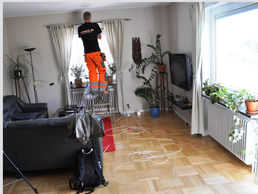
Installation av plastfiber på Vallvägen