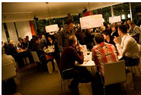
Del av Radjos Restaurang