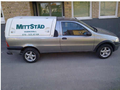
Firmabilen ståendes utanför kontoret