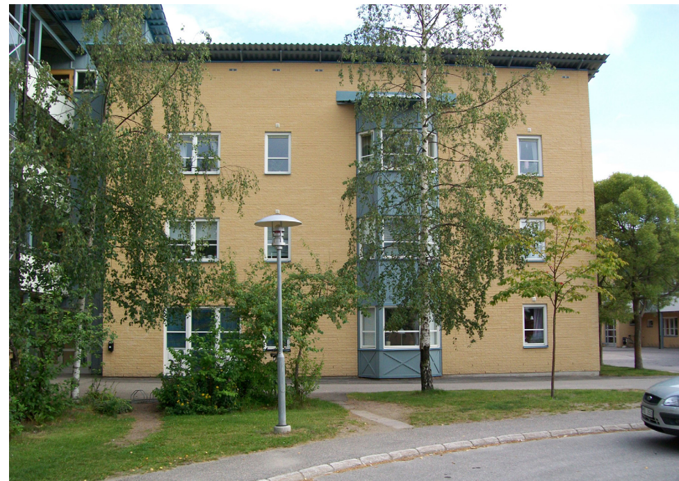
En grön del av Solbågen